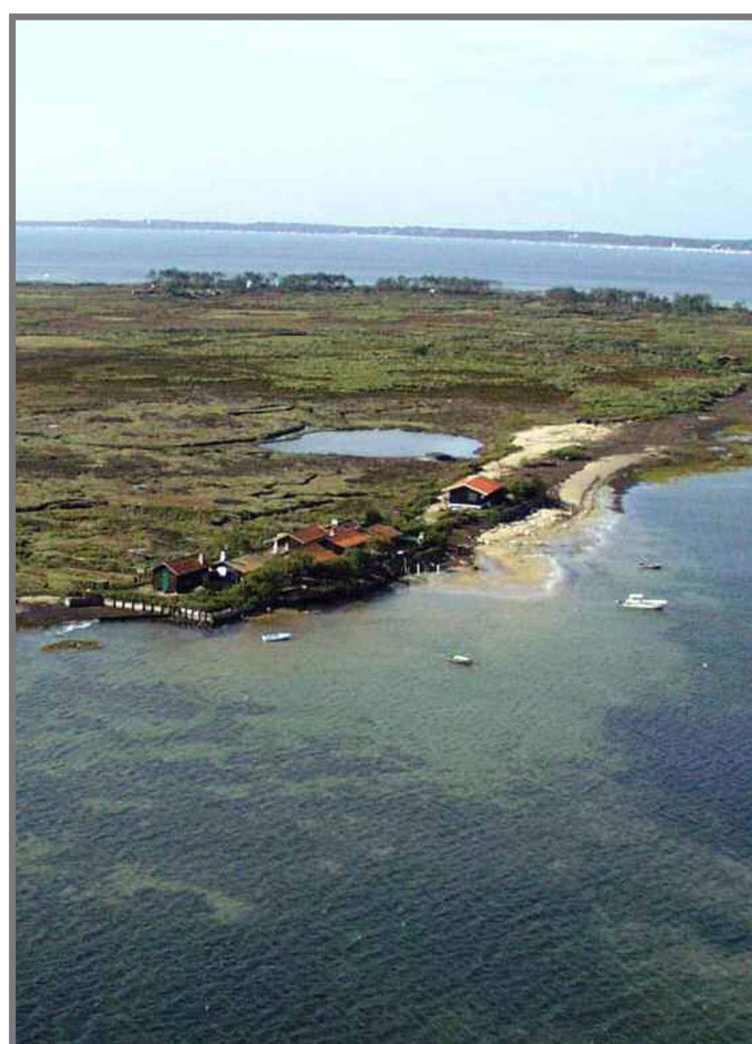
Le Port de l'île, au Nord.