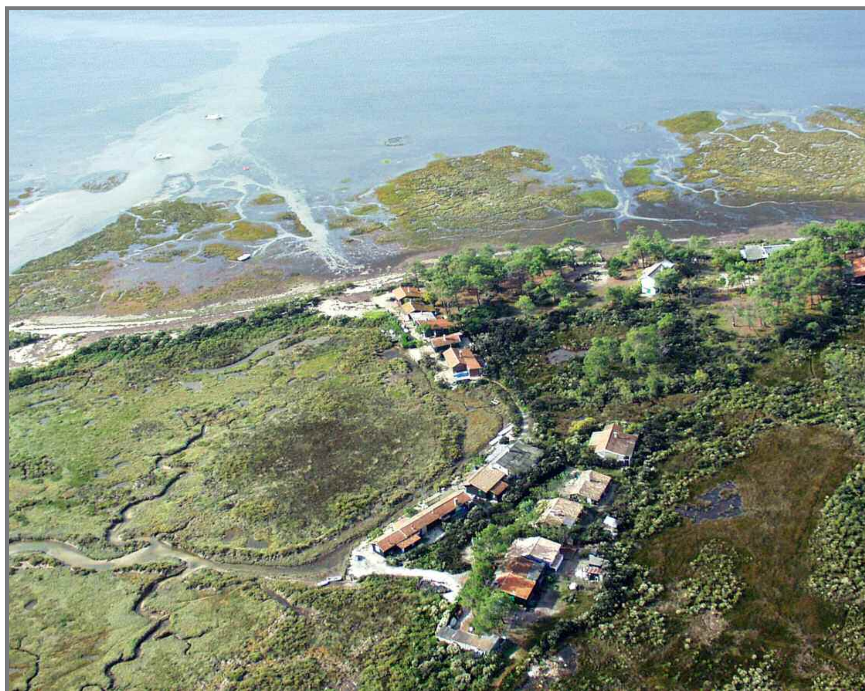
Le quartier Afrique regroupe des cabanes situées sur le domaine public maritime et sur le domaine privé.